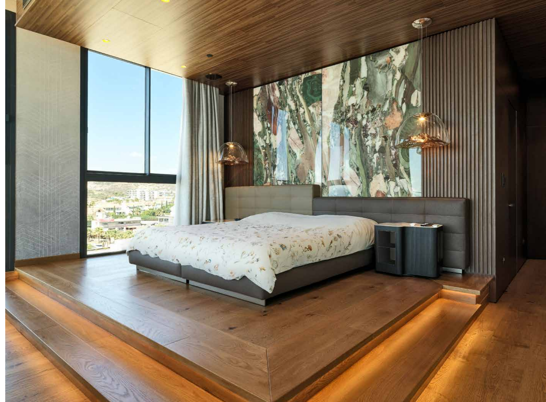
Vari scorci dell'originalissima camera padronale dove troneggia il letto matrimoniale Minotti adagiato su un podio illuminato perimetralmente per creare una maggiore suggestione. La testata sottolineata da due pannelli decorativi di Tecnografica è retroilluminata e costituisce la quinta che nasconde la cabina armadio. Fronte letto si apre un salotto che grazie alla grande vetrata offre una vista spettacolare.