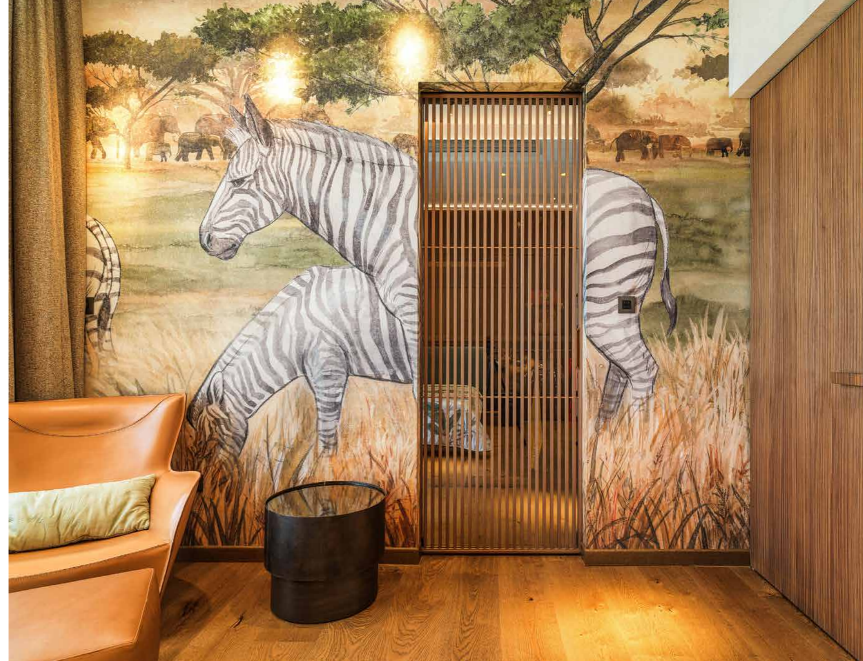
Camera del bambino con letto Cantori e poltrona Molteni&C con pouf abbinato sullo sfondo di una scenografica parete rivestita con carta da parati Tecnografica, sempre in tema con la natura, e porta lignea di Rimadesio che accede alla cabina armadio.