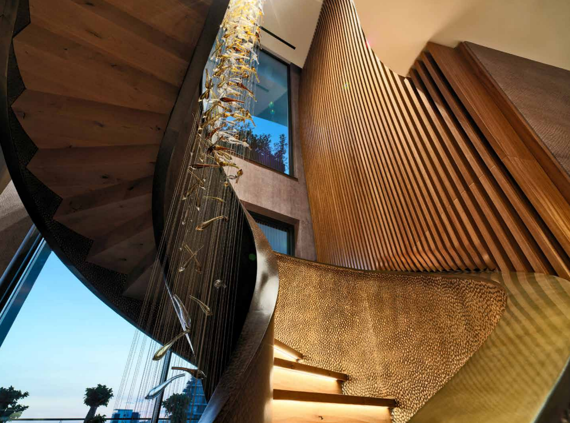
Scenografica la scala a chiocciola, realizzata con ringhiera in bronzo, martellato sul lato esterno e legno, ispirato alla pelle di pesce Pirarucu sul lato interno. La parete laterale è realizzata in legno di teak a forma di onde marine e la zona è impreziosita da un lampadario personalizzato, Sans Souci, in vetro soffiato. Sotto: bagno degli ospiti con mobili su misura.