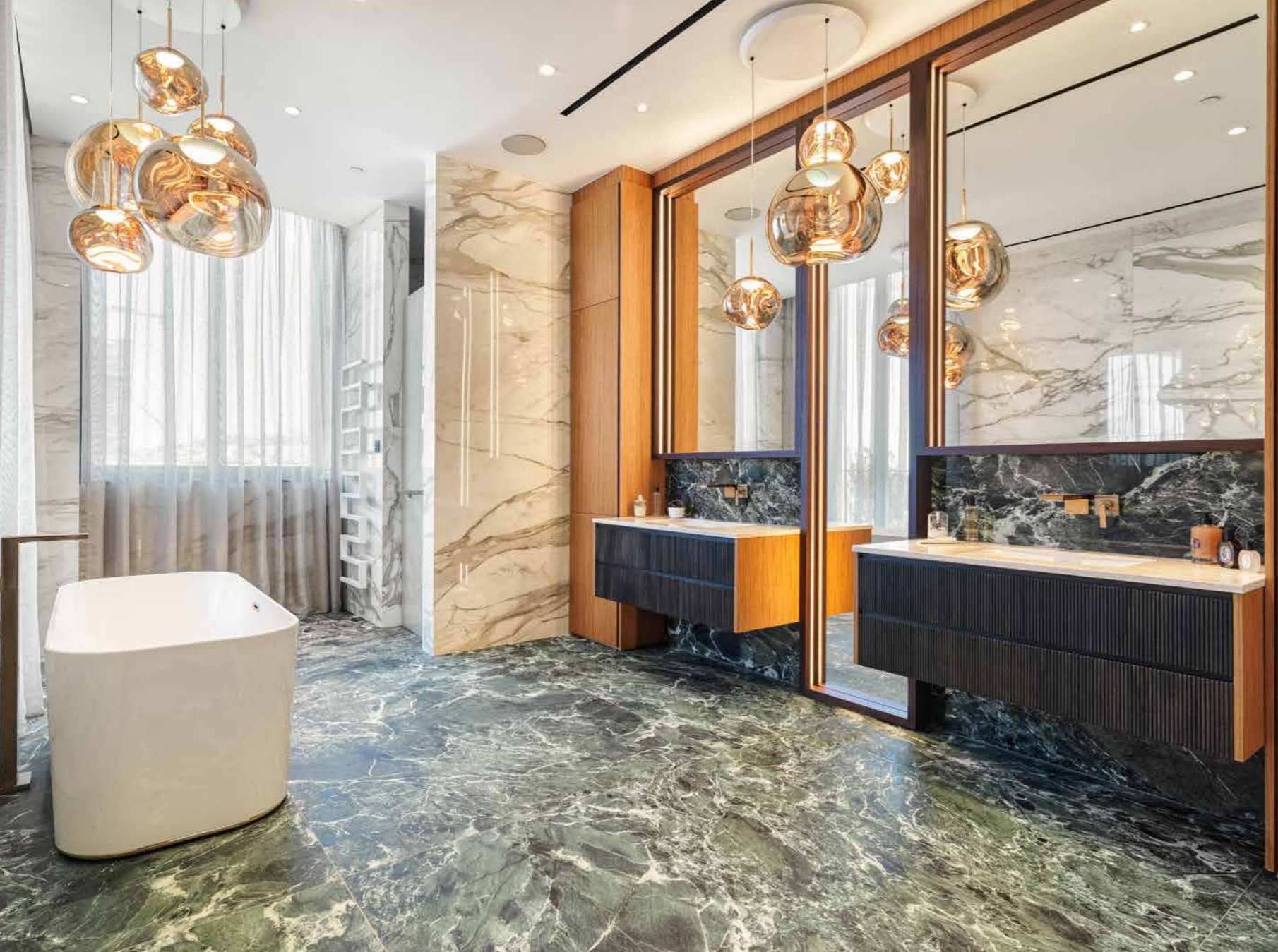
Elegante e raffinato anche il bagno padronale rivestito con piastrelle in ceramica a tema marmo che dialogano armoniosamente con il resto degli elementi interni. Mobile su misura realizzato in teak e rovere scanalato completamente simmetrico, con specchi giganti a tutta altezza che moltiplicano uno spazio già grandioso. La retroilluminazione a led integrata delle cornici degli specchi crea un portale mistico che riflette il lampadario di Tom Dixon tra i due lavabi e sopra la vasca da bagno free standing.